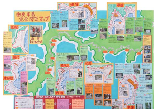
文部科学大臣賞 愛媛県南宇和郡愛南町立家串小学校「家串ドリームチーム」

優秀賞である文部科学大臣賞を受賞した愛媛県南宇和郡の愛南町立家串小学校の5、6年生6名の作品では、近年の震災から学んだことを生かし、自分たちの地域を見直したところ、高台に早く逃げるこ